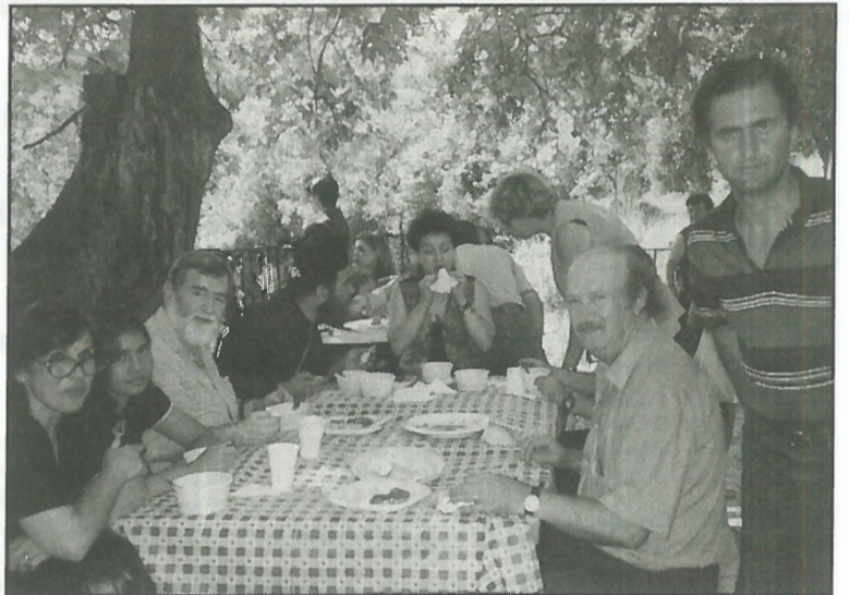
Από τη δεξίωση στο «Πανσίλυπο» της Αγίας Παρασκευής. Οι εκδρομείς απόλαυσαν τις παραδοσιακές πίτες, το ζυμωτό ψωμί και τη φασολάδα. Δεν τραγουδίσαν όμως, και αυτό είναι στα μείον της εκδήλωσης. Ας ελπίσουμε ότι θα γίνει κι αυτό του χρόνου.

Την Κυριακή το πρωί έγινε αιμοδοσία στο Αγροτικό Ιατρείο του χωριού μας. Η συμμετοχή ήταν μικρή. Μόνο δέκα έξι (16) συγχωριανοί μας πρόσφεραν το αί-